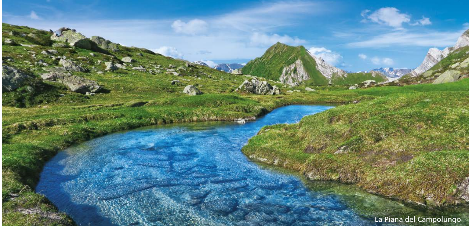
La Piana del Campolungo