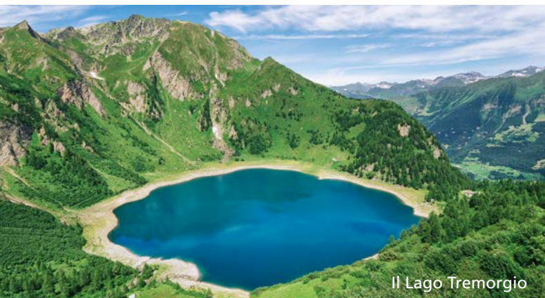
Il Lago Tremorgio

Il Tremorgio è una meta apprezzata dagli appassionati della montagna di tutte le età: per un pranzo in capanna, per una passeggiata attorno al lago con la famiglia o come punto di partenza di una delle innumerevoli escursioni offerte dall'incantevole regione.