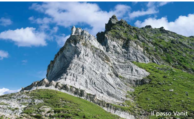
Il passo Vanit